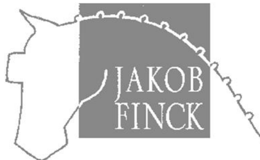
Etikettensymbol Weingut Jakob Finck/Schlossmühle

Die Wingert beider Weingüter liegen zum größten Teil auf Pfälzer Seite weshalb wir unsere Wein auch als Pfälzer Weine deklarieren.